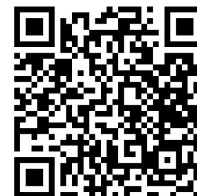
銅山川3ダム貯水状況 【新宮・柳瀬・富郷】 (QRコード)

リアルタイムのライブカメラは水資源機構池田総合管理所の ホームページでご覧いただけます